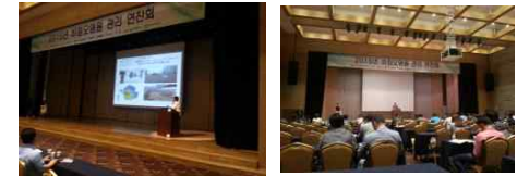
▲ 저영향개발사전협의제도 안내 (물재이용관리팀장) ▲ 2015 비점오염 연찬회

'빗물 소리'는 서울특별시(물관리정책과)와 빗물이용주치의 분들 등이 정보와 소식을 공유하고 소통하기 위하여 매월 발행됩니다. 다른 분들에게 소개하거나 공유하면 도움이 될 내용이 있으면 연락주시기 바랍니다.